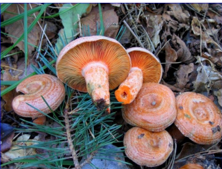
Le Roussillous ( Lactarius deliciosus ) = comestible plus ou moins apprécié selon les régions