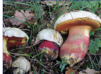
Bolet de satan ( Boletus satanas ) = toxique violent surtout s'il est consommé cru ou mal cuit.