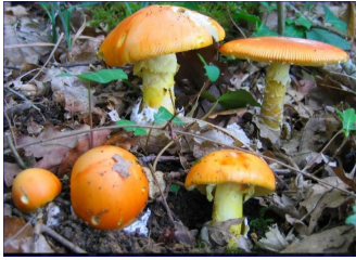
L'Oronge ( Amanita caesarea ) = excellent comestible. Attention à l'Amanite tue-mouche