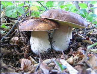
Le Cèpe ( Boletus edulis ) = excellent comestible . Très recherché dans nos régions