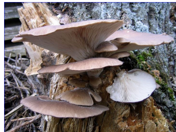
Pleurote en huître ( Pleurotus ostreatus ) = bon comestible jeune. Se rencontre sur le bois de divers feuillus.