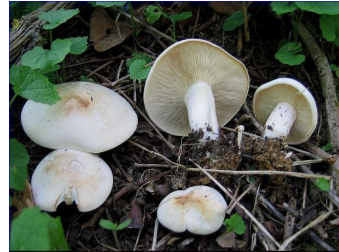
Le Mousseron ( Calocybe gambosa ) = excellent comestible très recherché au printemps. Attention à l'Entolome livide, toxique