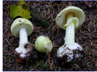
L'Amanite phalloïde ( Amanita phalloides ) = mortel. Le plus dangereux de tous les champignons. Tout champignonneur doit le connaître