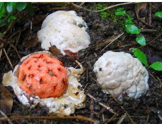
Cœur de sorcière ( Clathrus ruber ) = non comestible. Curiosité mycologique, sa puanteur attire les mouches